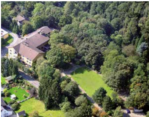
Haus am Turm

Ev. Bildungswerk Essen III. Hagen 39 45127 Essen