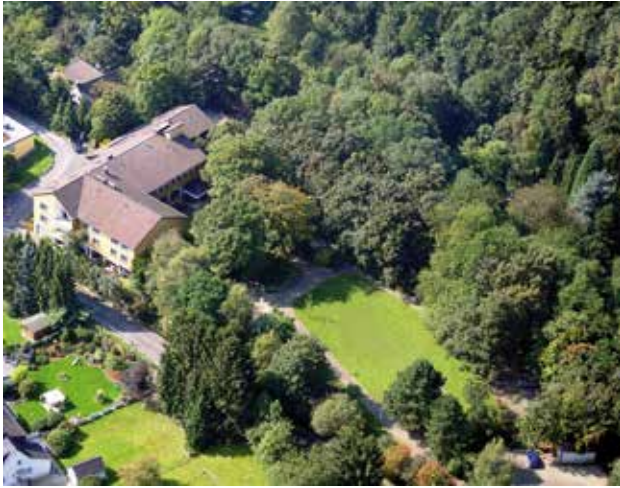
Haus am Turm

Anmeldung zum Kurs Feldenkrais und Meditation im Haus am Turm, Essen Werden, Am Turm 7